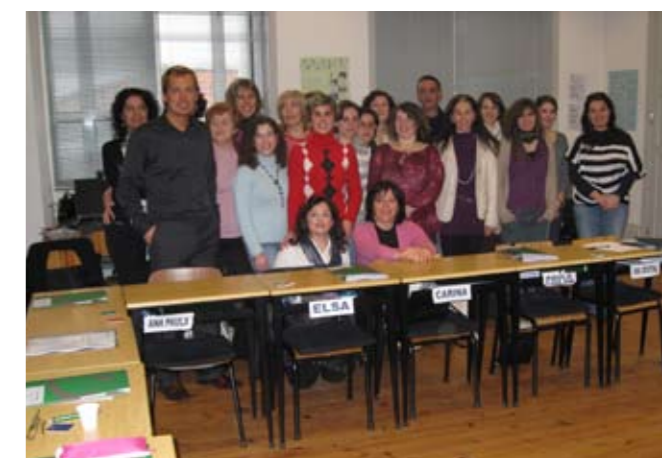
Formação de Recepcionistas - actividade prática e foto de grupo